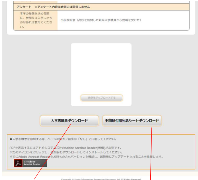
岐阜大学入学志願票(学校推薦型選抜Ⅱ用)