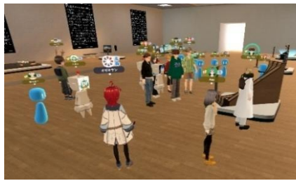
授業風景(メタバース文化論)