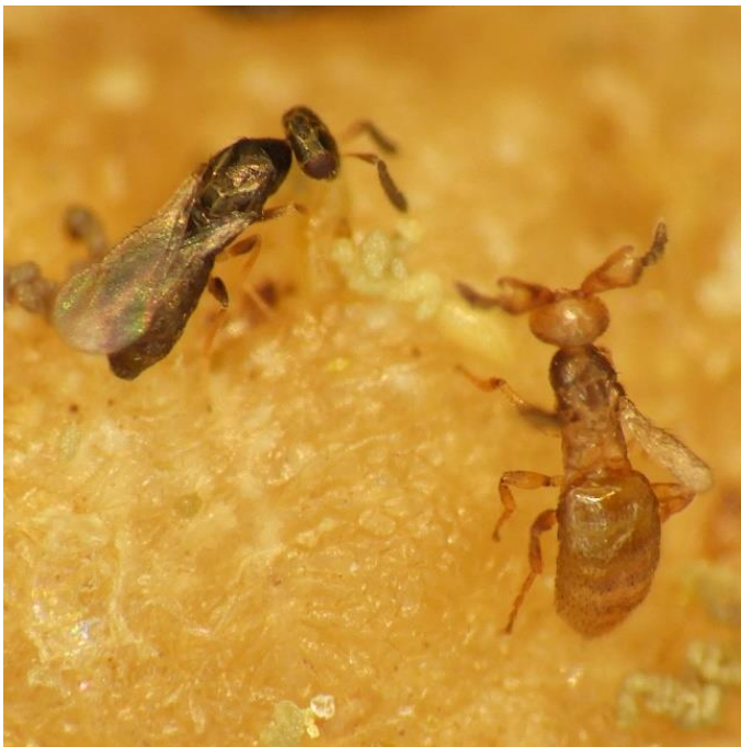
図2. メリトビア ( Melittobia australica ) のオス (右側の茶色い個体) とメス (左側の黒い個体) の成虫. 体長 1 mm 程度で, 性的二型が顕著. オスは複眼を欠き, 翅が小型で飛ぶことはできない. 羽化後オスが分散することはなく, 一緒に育ったメスたちと交尾を繰り返して一生を終える. 交尾したメスは, 新たな寄生先を求めて分散する.