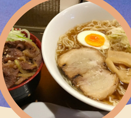
高山ラーメンと飛騨牛