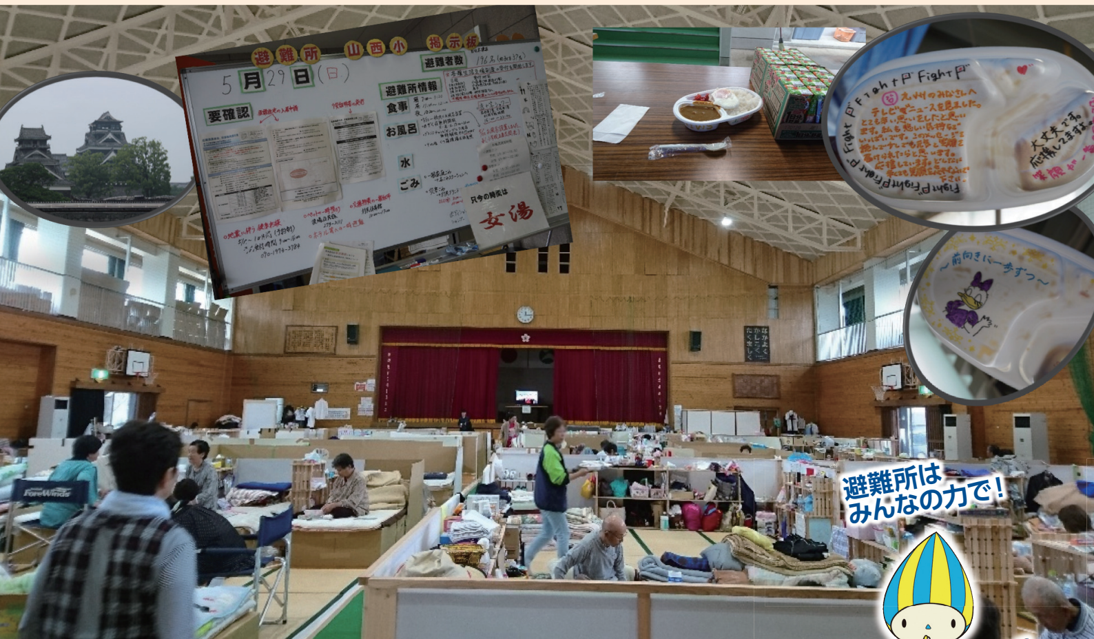
写真:熊本地震