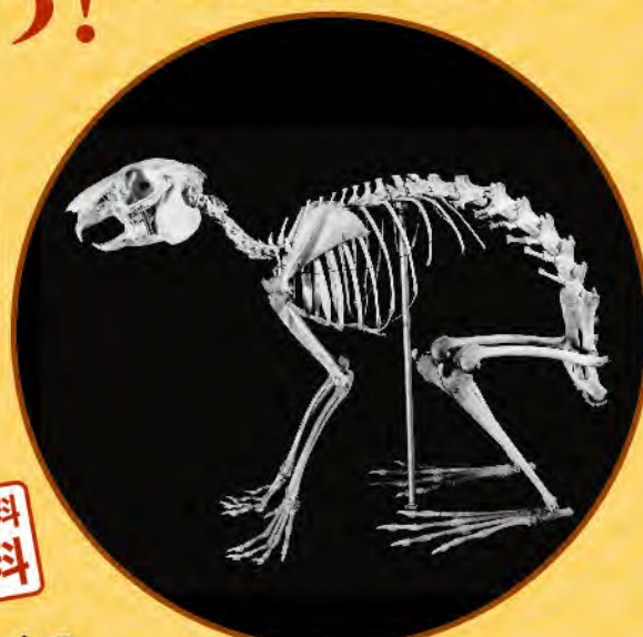
ニホンノウサギ骨格 (岐阜県博物館蔵)