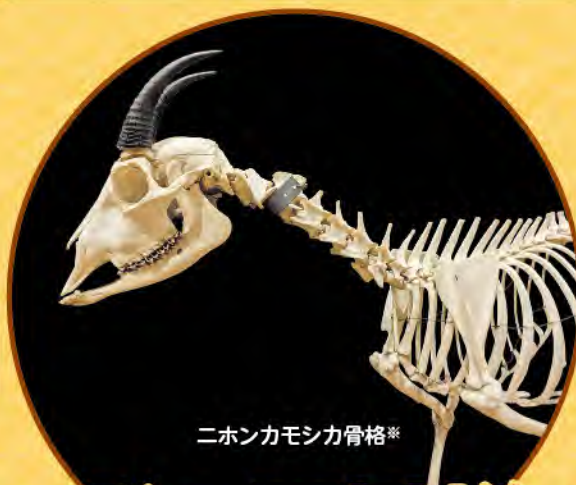
ニホンカモシカ骨格*