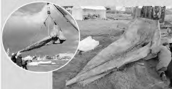
砂地から掘り出したマッコウクジラの頭骨