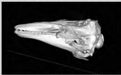
ベルーガ頭部CT像