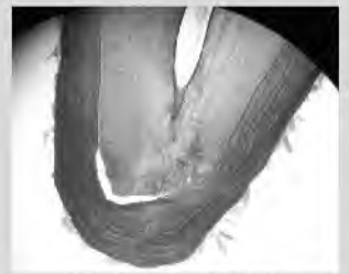
ツキノワグマ歯の切片