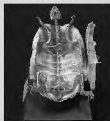
戦前の学校で使われた 二ホンイシガメの骨格 (岐阜県博物館蔵)