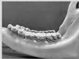
キリン下顎の歯 (国立科学博物館蔵)