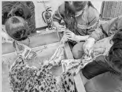
チーター遺体の解剖実習風景