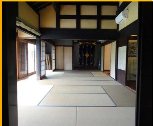
会場となる畳敷きの部屋 (車座型式で行います)