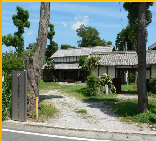
旧早野邸セミナーハウス正面

日々の体力づくりや病気の予防対策等を行うことは、健康で豊かな生活や人生を送れる可能性を高める。高齢期においては、病気や障がいの有無にかかわらず、健康を維持・増進するための日頃からの心掛けが大切な点となる。本講演では、自分の身近にいる他者の生き方や考え方等を題材に、最期の時まで自分らしい生活を送ることの「自分らしさ」とは何か、どうすれば実現できるのかを考え、答えを見出すきっかけを一緒につくりたい。