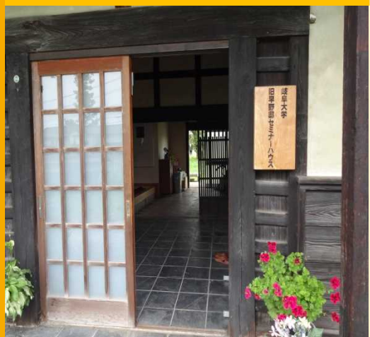
旧早野邸セミナーハウス玄関