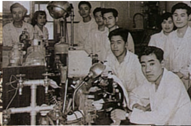
学芸学部生物学科実習風景 (昭和28年ごろ)