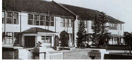
学芸学部加納校舎の 正面玄関