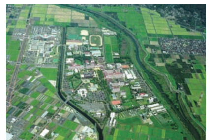
柳戸キャンパス(現在)