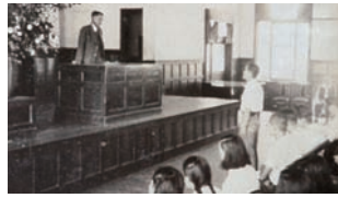
加納校舎で行われた第1回入学式 (昭和24年7月15日)