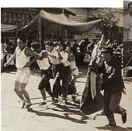
開学祭運動会(昭和24年10月16日)