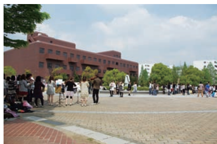
学生の集いの広場「丸池」(現在)