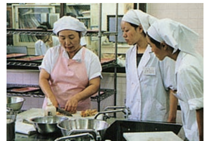
授業の一環として生協で社会活動する学生たち (平成9~11年ごろ)