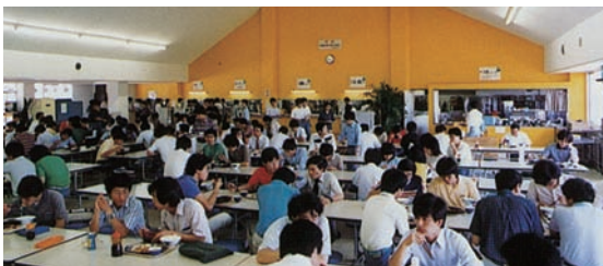
満席状態の学生食堂(昭和58年10月ごろ)