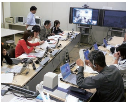
テレビ会議を利用した授業(現在)