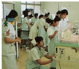
看護師実習風景(平成4~11年ごろ)