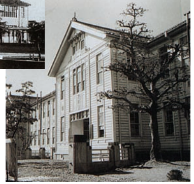
那加キャンパス正面