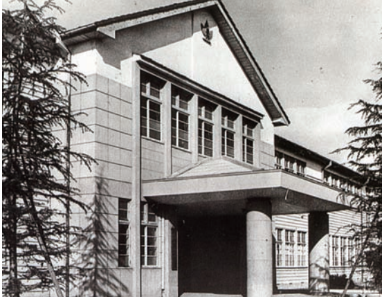
岐阜県立医科大学校舎の正面玄関

創立60周年を迎えた本学ですが、各学部部のルーツとも言うべき組織から辿ると130年以上の歴史があります。その時代の人々や建物・施設など、受け継がれてきた伝統・学風を振り返るべく、岐阜大学の沿革を写真で綴ってみました。