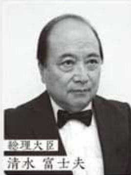
総理大臣 清水 富士夫