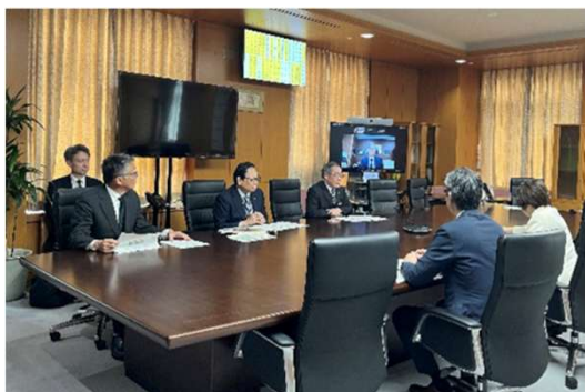
あべ大臣との意見交換の様子