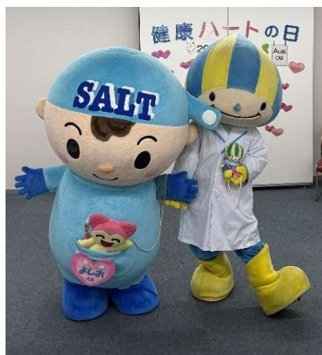
良塩（よしお）&ミナモ