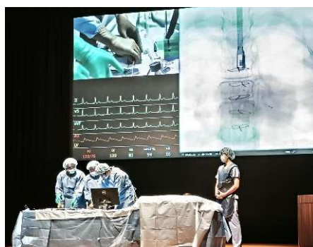
デモンストレーション