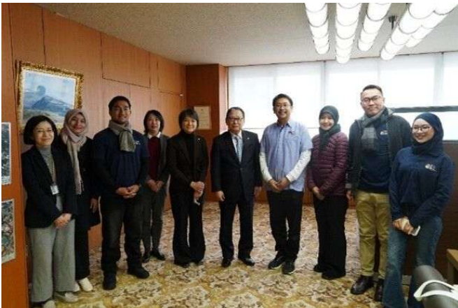
マレーシア国民大学訪問団との記念撮影

今回の交流を通じて、両大学の学生・教職員間の連携が一層深まり、ジョイント・ディグリープログラムを含む国際交流のさらなる発展が期待されます。