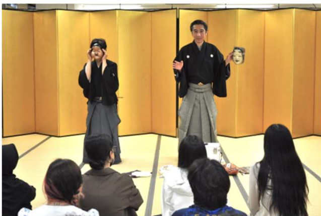
能と狂言の面の違い