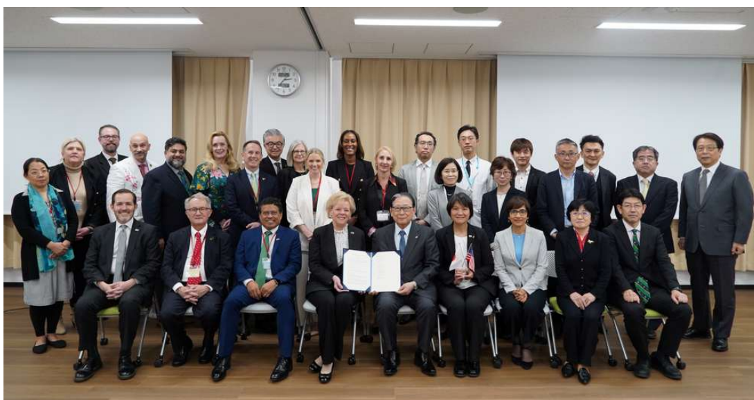
調印式後の記念撮影

今回の訪問により、岐阜大学と南フロリダ大学の学術交流がさらに深まり、学生や研究者の一層の交流が促進されることを期待されています。