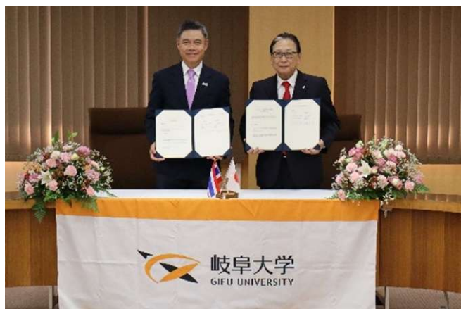
大学間学術交流協定更新の署名式

今回の協定更新により、岐阜大学とチェンマイ大学は学生交流・学術交流をさらに深め、教育・研究交流を推進してまいります。