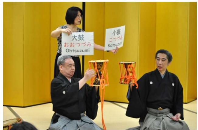
能楽で使用する楽器