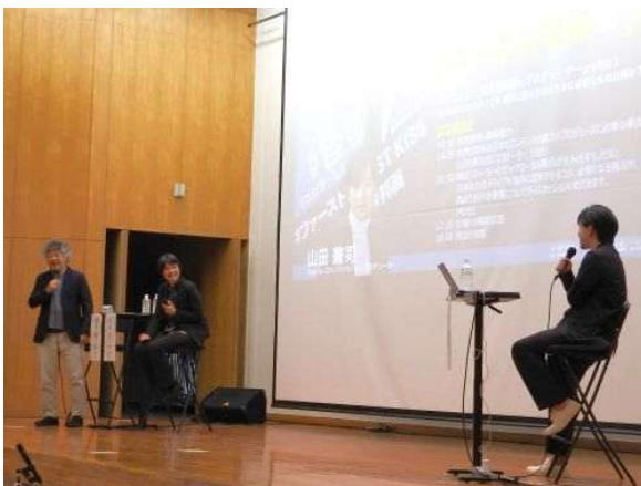
クロストークの様子