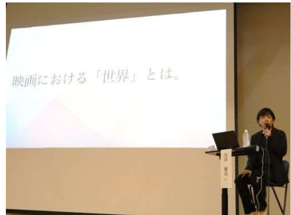
山田氏による講演