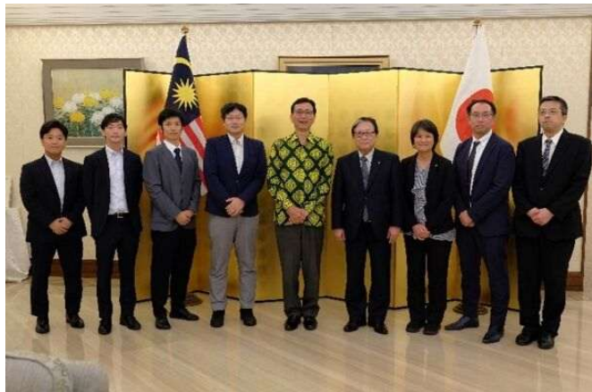
在マレーシア日本国大使館での集合写真