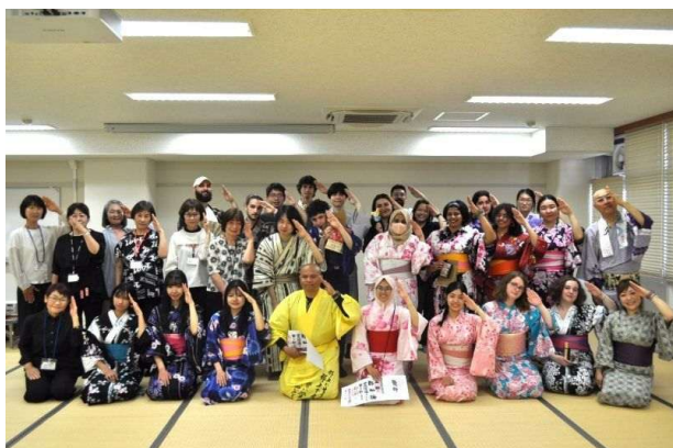
「かわさき」ポーズで集合写真