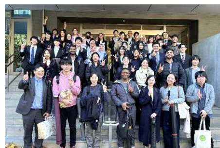
ポスタープレゼンテーション 参加者の集合写真