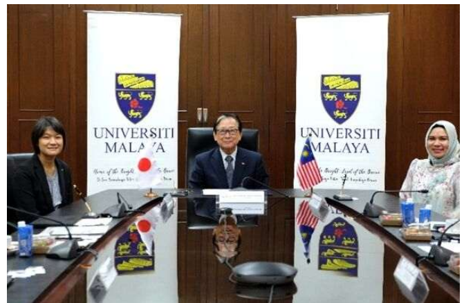
マラヤ大学におけるLoI署名式