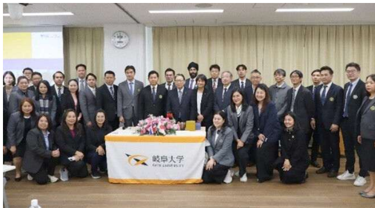
シーナカリンウィロート大学訪問団との記念撮影