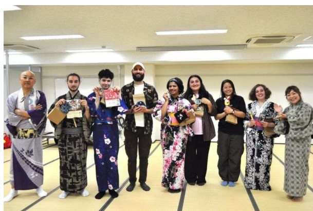
郡上市ゆかりの記念品と留学生