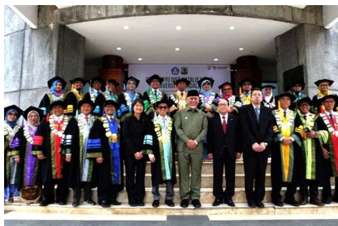
アンダラス大学創立記念行事での集合写真