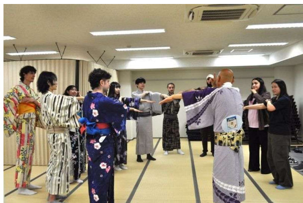
「かわさき」を習う留学生たち