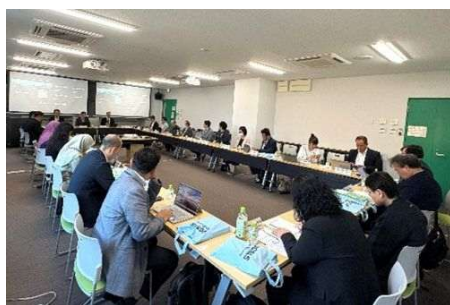
IC-GU12ラウンドテーブルの様子