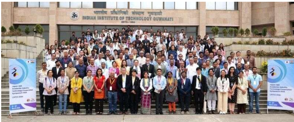
シンポジウム参加者との集合写真

岐阜大学は、今回のシンポジウムおよびLoI署名を新たな起点として、北東インド地域を中心とした日印の学術・研究・産学連携をより強固にし、「地域から世界へ」の理念のもと、今後もより一層国際展開を推進してまいります。