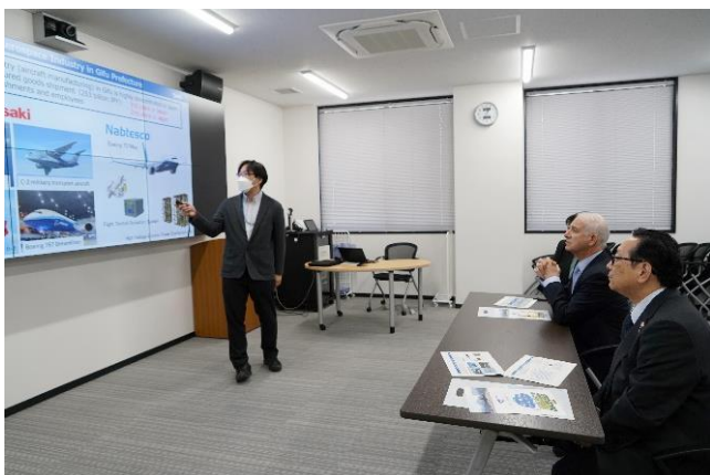
施設見学（航空宇宙生産技術開発センター）