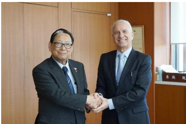
ラシャッド・ブフラル駐日モロッコ王国特命全権大使（右）と吉田学長

今回の訪問を機に、同国の大学との学生・研究者交流が開始されることが期待されます。