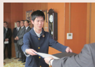
「ISO14001 内部環境監査員養成研修」 修了証書授与式