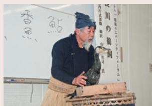
環境ユニバーシティフォーラム