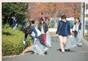
学生・教職員による クリーンキャンパス

「環境ユニバーシティ」宣言日（2009年11月27日）に因り、毎年11月を岐阜大学環境月間と定め、さまざまな関連行事を行っています。