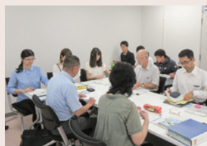
学生による ISO14001の内部環境監査