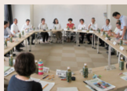
他大学との意見交換会