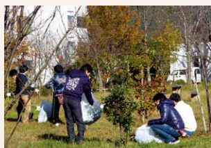
学生・教職員による クリーンキャンパス

「環境ユニバーシティ」宣言日（平成21年11月27日）に因んで、毎年11月を岐阜大学環境月間と定め、さまざまな関連行事を行っています。