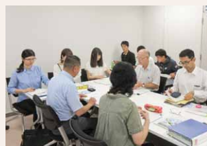
学生による ISO14001の内部監査