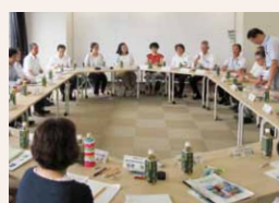
他大学との意見交換会