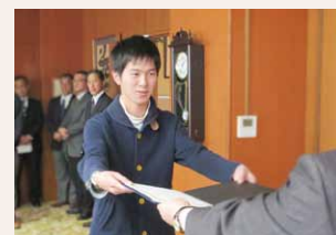
「ISO14001 内部環境監査員養成研修」 修了証書授与式