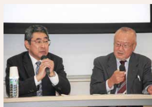
環境ユニバーシティフォーラム