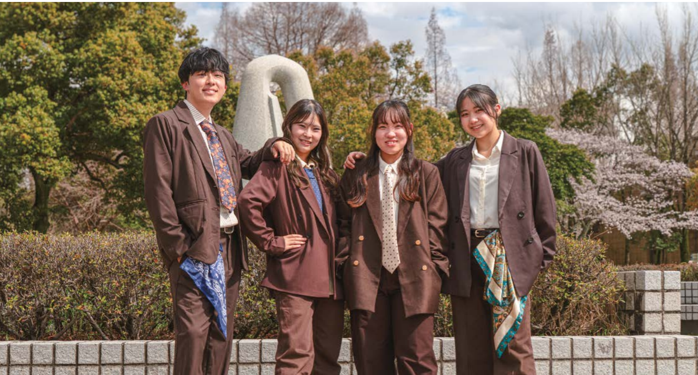
ストリートダンス部 MEC (Mighty Elements Crew) 幹部

体育館に響き渡る音楽と軽快なステップ。そして、130人を超えるストリートダンサーのパワーと熱気。仲間とともに楽しみながら、今日も新しいリズムを刻み続ける、ストリートダンス部MECの現在地を紹介します。