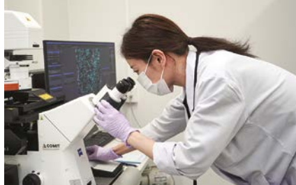
共焦点顕微鏡で免疫染色組織を撮影