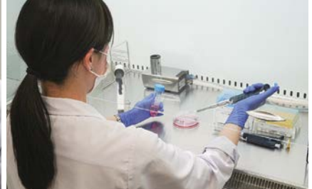
クリーンベンチ内で培養細胞を維持