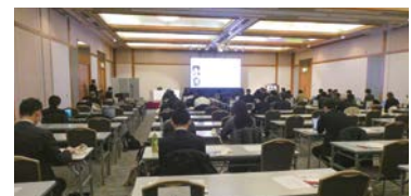
COMITシンポジウムは高校生を含む200人超が参加。

期生25名が修了しました。病気は誰もが罹るもの。人類はこの先も新たな薬を創ろうと試みるでしょう。これからも、私たちの研究成果を引き継ぎ、新たな視点を加えて前進させてくれる次世代の育成に努めます。