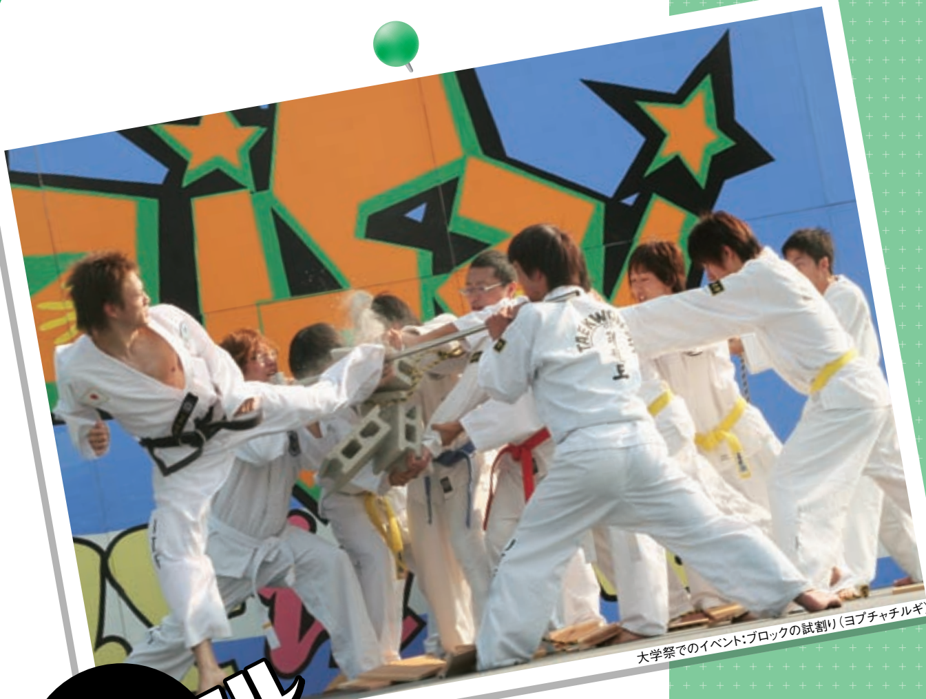
大学祭でのイベント:ブロックの試割り(ヨプチャルギ)