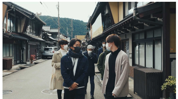
郡上八幡のまち歩きの様子