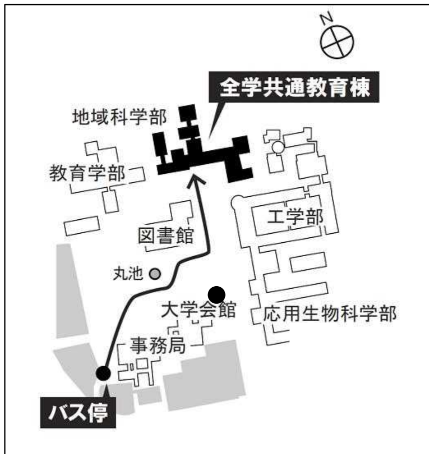
校内地図 教室の場所

(※つながらない場合は、058-293-2025 におかけ 頂き、対応者に伝言をお願いします。)