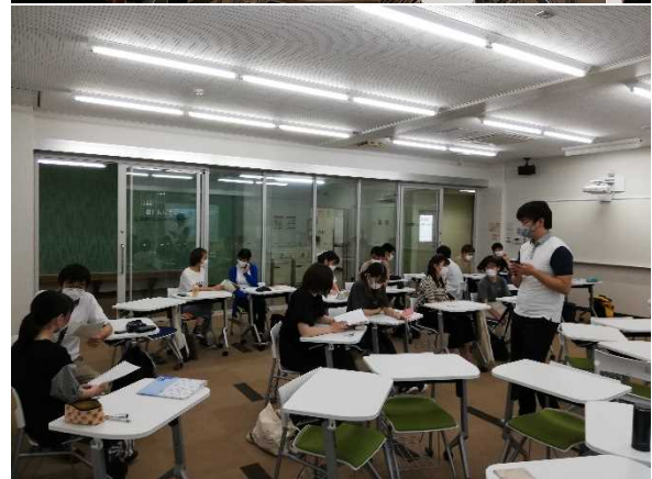
教室とオンラインを併用した授業の様子