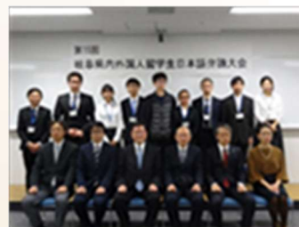
第15回大会発表者と審査員のみなさん

問合せ：国立大学法人岐阜大学グローバル推進本部留学支援室内(岐阜大学図書館1F)