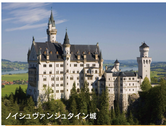
ノイシュヴァンシュタイン城