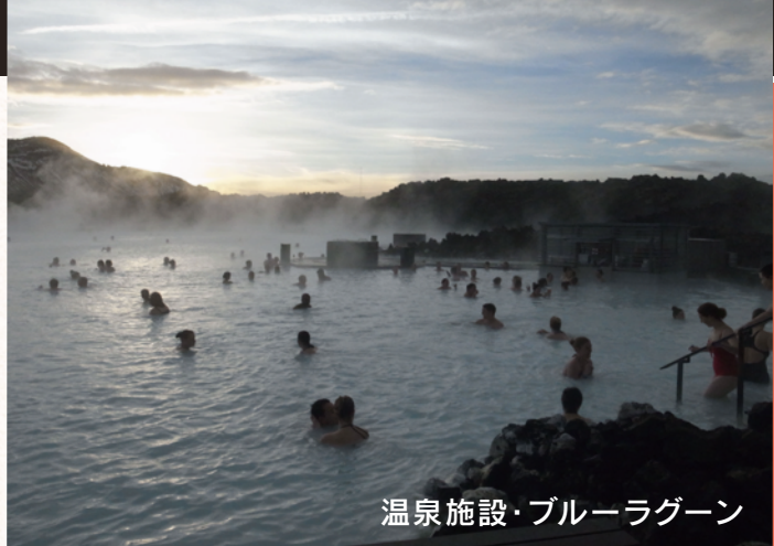
温泉施設・ブルーラグーン

アイスランド語は、日本ではあまり聞きなれない言語ですが、北欧の国アイスランドで話されている言葉です。北欧の国と言えば、スウェーデンやデンマーク、ノルウェー、フィンランドを思い浮かべるとと思いますが、実は、アイスランドも北欧の国の1つです。