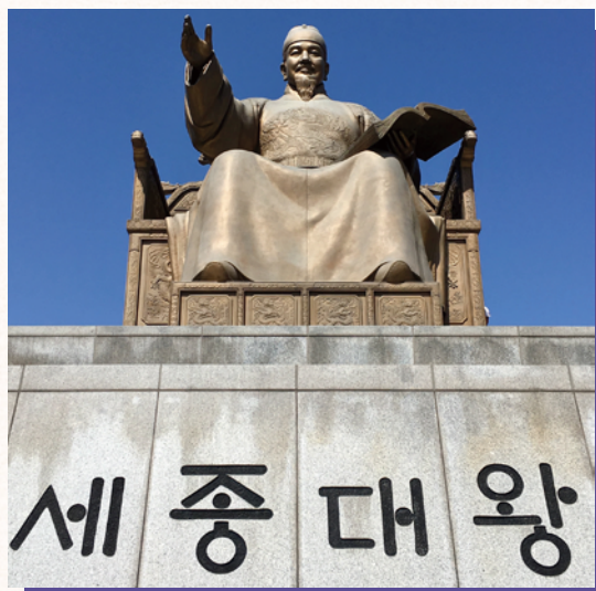
ハングル創始者・世宗大王 (15世紀半ばごろ)