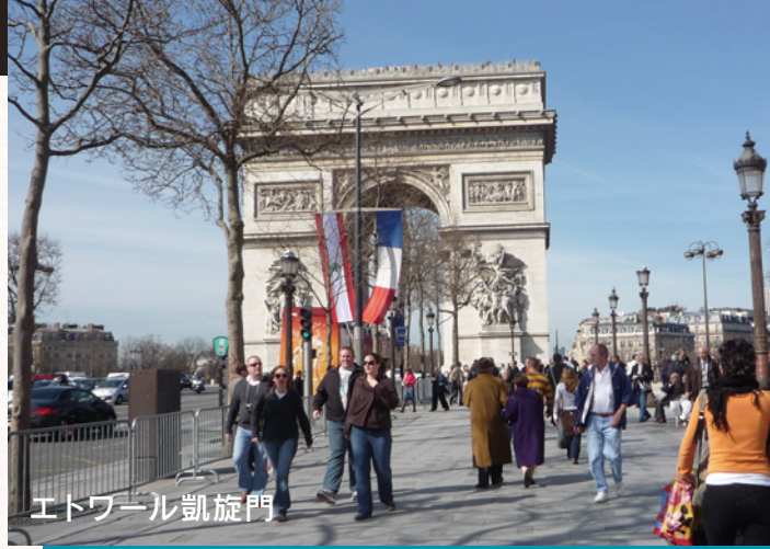
エトワール凱旋門

フランス語は、フランス本国だけでなく、ベルギーやスイスなどのヨーロッパ諸国、またカナダなどアメリカ大陸の国々、そして西アフリカ諸国でも使用されている、国際的な言語です。フランス語を公用語としている国は29ヶ国にのぼり、これは英語に次ぐ世界第二の地位にあたります。国際連合の公用語として使われているのをご存知の方もいるかもしれません。