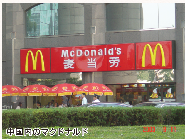
中国内のマクドナルド