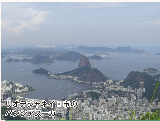
リオデジャネイロ市の パンジアスーカ