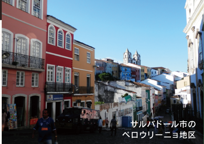
サルバドル市の ペロウリーニョ地区

ポルトガル語が公用語の国は世界に8ヶ国ありますが、授業で勉強するのはその中でも最も話者人口の多い「ブラジル」のポルトガル語です。文化紹介もブラジルについて取り扱います。ブラジルと聞くと誰もが「サッカー」「コーヒー」「リオのカーニバル」「アマゾン」など何かしらイメージが湧く国ですよね。ブラジルは地理的には日本から遠いですが、実は世界の中で日本人・日系人が最も多く住んでいる国なんです。