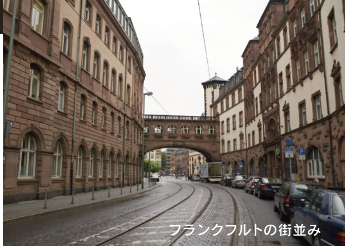
フランクフルトの街並み

ドイツ語は中国語、英語、ヒンディー語、スペイン語などに次いで使用人口がとても多い言語です。ある資料によると、ドイツ語を母語として話す人の総人口は日本語と同じくらいで、その多さは世界で第10位(日本語は第9位)となります。