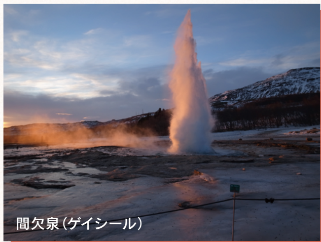
間欠泉(ゲイシール)