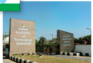
インド工科大学グワハティ校