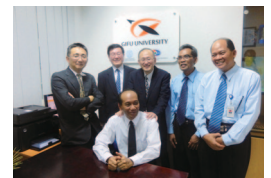
インドネシアオフィス