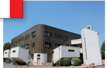
パリ第11大学(医学部)