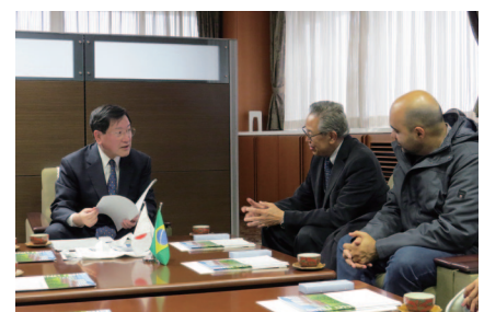
カンピーナス大学(ブラジル)の来訪

2015年2月25日 インド工科大学グワハティ校(インド) P.S.ロビ 機械工学科教授 他1名