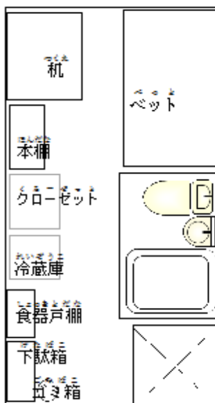
とうたんしんしつ A棟単身室